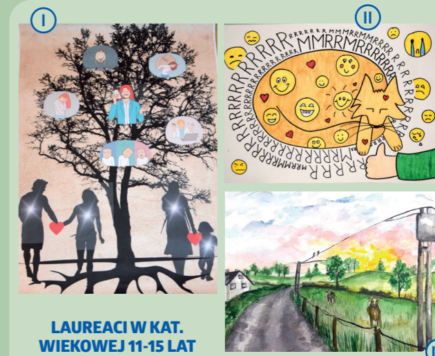
LAUREACI W KAT. WIEKOWEJ 11-15 LAT