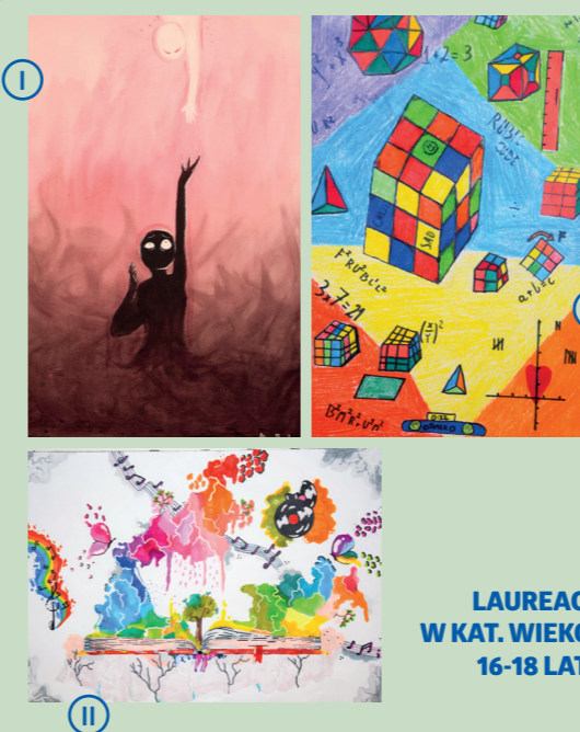
LAUREACI W KAT. WIEKOWEJ 16-18 LAT